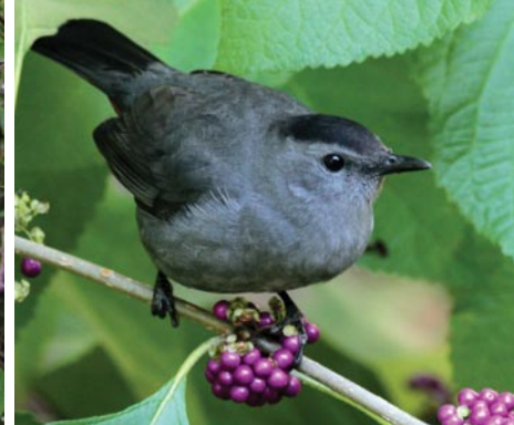
Gray Catbird on Beautyberry