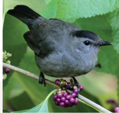
Gray Catbird on Beautyberry